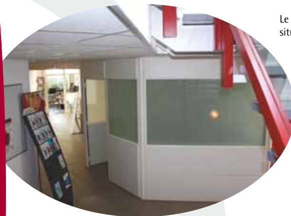
Le bureau des permanences situé dans le hall de la Mairie