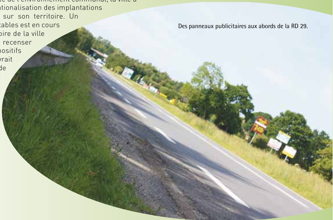
Des panneaux publicitaires aux abords de la RD 29.

La TLPE résulte de l'article 171 de la loi de modernisation de l'économie d'août 2008. L'assiette de cette taxe frappe tous les dispositifs publicitaires fixes visibles de toute voie (publique ou privée), ouverte à la circulation publique. Sont considérés comme dispositifs publicitaires, les supports publicitaires fixes, les enseignes et pré-enseignes. L'objectif de la TLPE est d'éviter la prolifération des publicités extérieures. En effet, Saint-Grégoire, comme de nombreuses autres villes françaises, a été victime de la prolifération de panneaux publicitaires vantant les mérites de divers produits et services. Dans un souci de préservation de la qualité de l'environnement communal, la ville a souhaité procéder à une rationalisation des implantations de supports publicitaires sur son territoire. Un inventaire des supports taxables est en cours de réalisation sur le territoire de la ville de Saint-Grégoire pour recenser les différents dispositifs publicitaires. La TLPE devrait permettre à terme de réduire considérablement la prolifération des panneaux publicitaires sur le bord des rues et routes de Saint-Grégoire, et de réduire également la pollution visuelle en résultant.