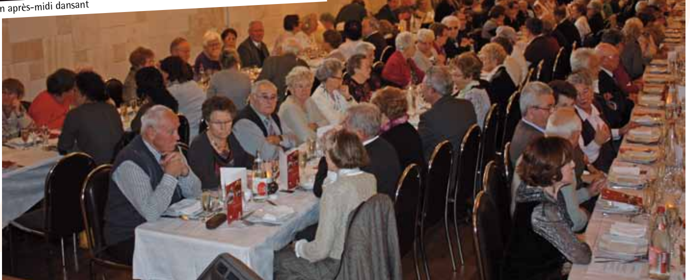
Un repas animé par des anecdotes et chants de chacun