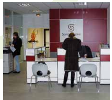
L'accueil de la mairie.

l'accueil plus attentif (efficacité et courtoisie), le temps de traitement des demandes, les réponses apportées aux usagers, l'amélioration permanente. Des mesures d'amélioration ont déjà été mises en place (signalétique en mairie, modernisation des outils...). L'objectif est d'obtenir la certification au 1 er janvier 2013.