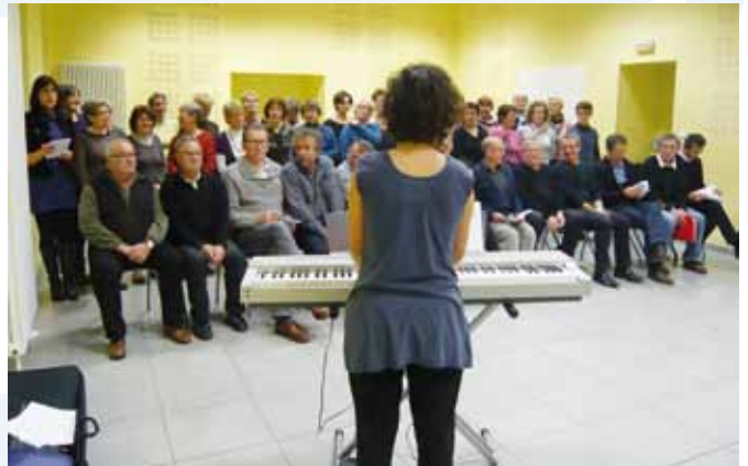
La chorale en répétition