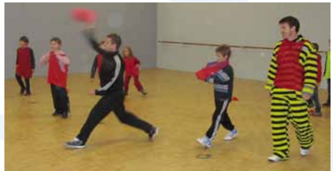
La balle aux prisonniers