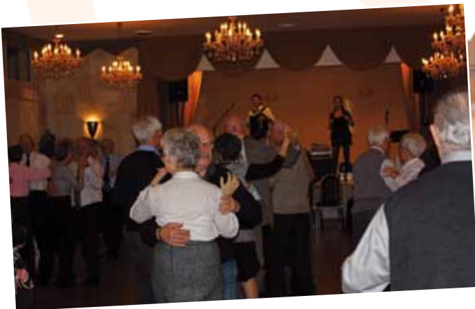
Un après-midi dansant