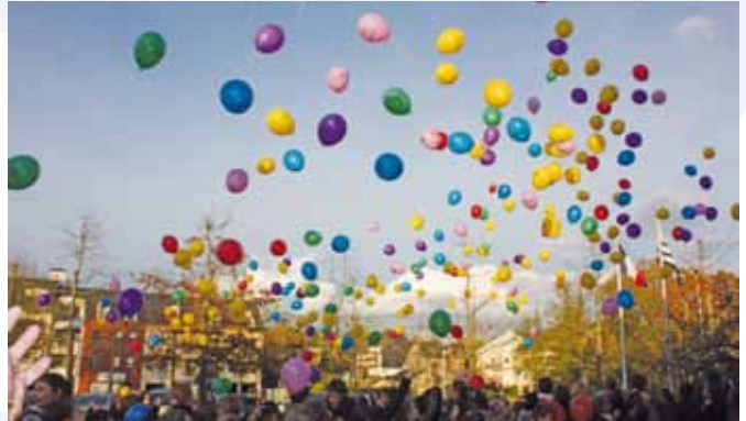
Le lâcher de ballons

Avec une collecte de 13200 euros, le comité organisateur tient à féliciter chaleureusement tous les acteurs impliqués dans cette grande aventure humaine de solidarité: la municipalité, les associations, les entreprises, les clubs et bénévoles qui ont cette année encore largement contribué au succès de cette 4 e édition du Téléthon à Saint-Grégoire. Ce fut encore une belle réussite collective dans une ambiance conviviale et festive.