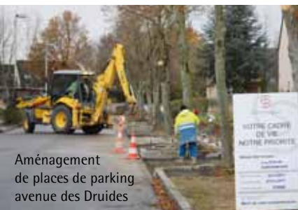
Aménagement de places de parking avenue des Druides

En ce début d'année, nous avons souhaité vous informer des travaux en cours sur la ville. La direction Prospective, Aménagement et Cadre de vie s'emploie à vous rendre la vie la plus agréable possible.