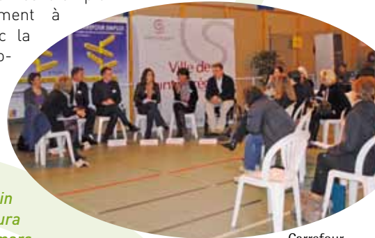
Carrefour Emploi 2011.

Pratique : le prochain Carrefour Emploi aura lieu le vendredi 23 mars.